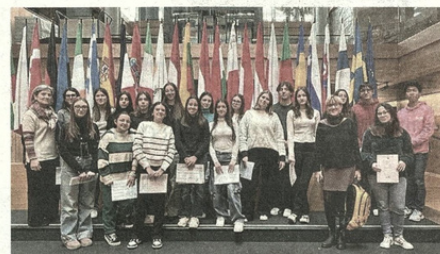
In Parlamento Da Brescia in viaggio fino a Strasburgo

Le classi 4C, 5A e 5D del Li- ceo Linguistico Veronica Gamba hanno affrontato un viaggio d'istruzione dal 26 febbraio al 2 marzo 2024 a Strasburgo, Friburgo e Col- mar per conoscere da vicino le istituzioni europee e con- frontarsi con il mondo lonta-