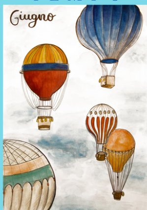
Mostra pittorica di ESTER CONTER 1D LSU 30 maggio 8 giugno 2023